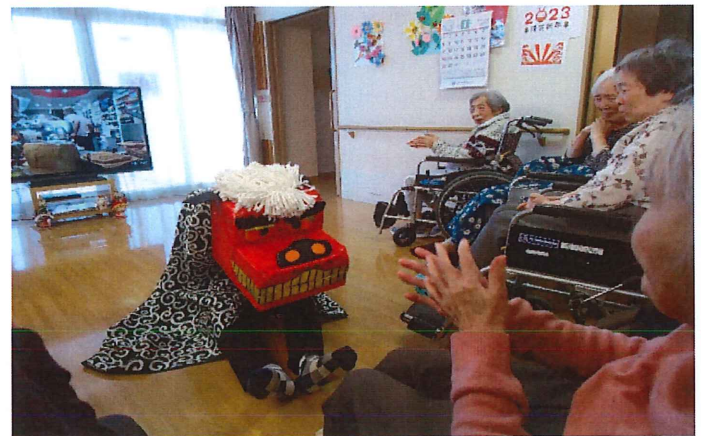
●お正月で獅子舞い大暴れ中。