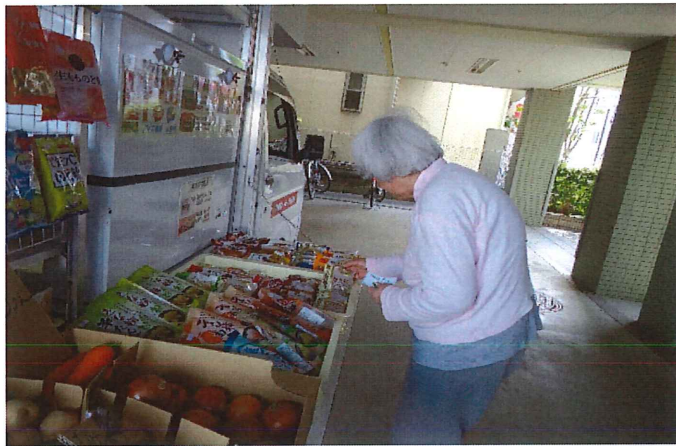
●移動販売で買い物中。