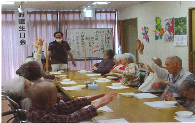
●4・5・6月お誕生日会。