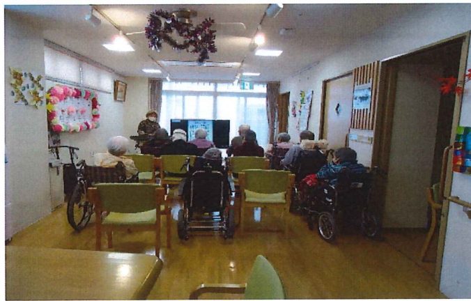
●音楽療法士による音楽会。